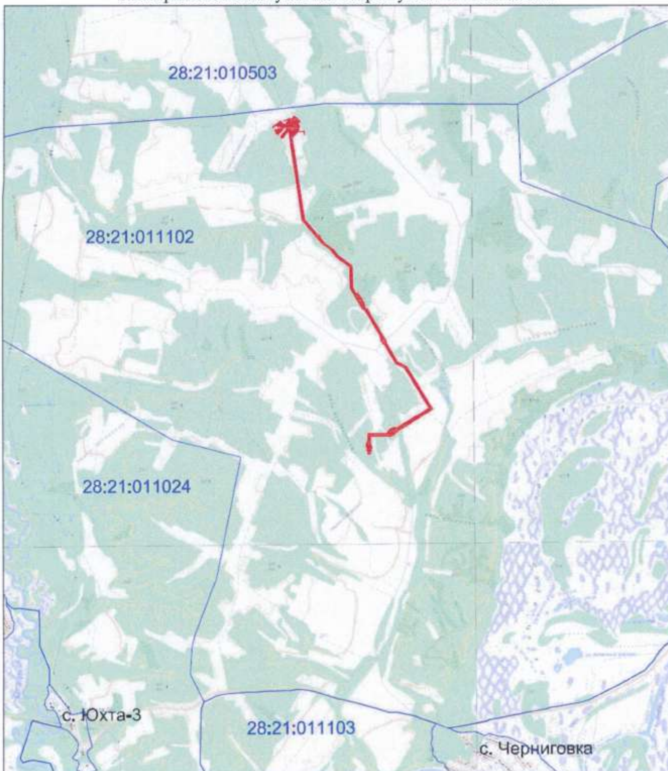
Схема расположения публичного сервитута линейного объекта